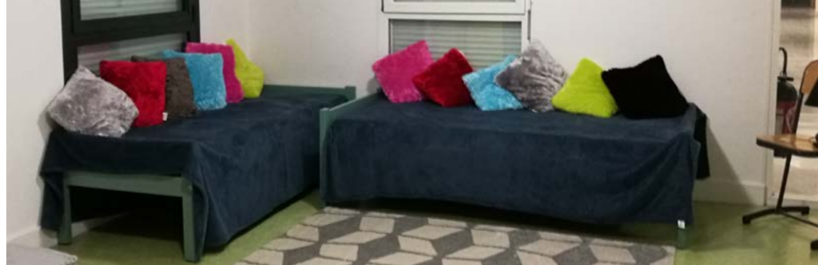
Aménagement du foyer des internes. Inauguration faite le 18 octobre 2018 : Espace cocooning - télévision - coin calme - jeux

Un voyage très apprécié par les jeunes qui remercient le lycée pendant leur séjour.